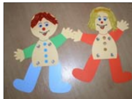
Na obrázcích (i na str. 1) práce dětí na téma Jaro a Velikonoce. Nahoře: Mikulášská diskotéka Vlevo: Výroba dekorací