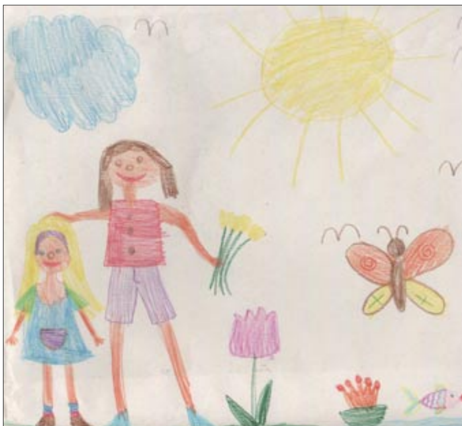
Výřez z obrázku Aničky Hartlové, 6 let

Autory všech výtvarných dílek v tomto čísle zpravodaje jsou děti z mateřské školy.