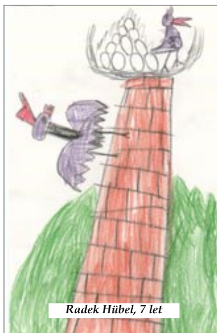
Radek Hübel, 7 let