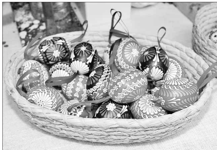
Velikonoční vejce zdobená pomocí vosku