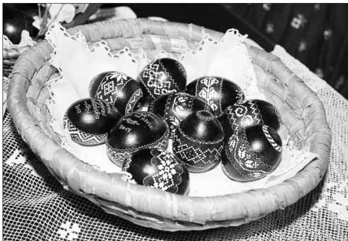
Černě nabarvená a vyškrabovaná velikonoční vejce