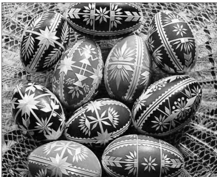
Velikonoční vejce zdobená slámovým dekorem