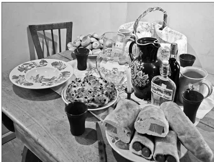
Velikonoční stůl v Kittelově muzeu