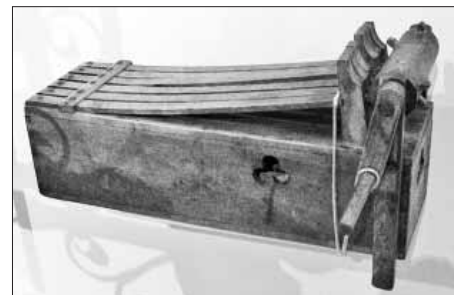
Karfreitagsratsche – Velkopáteční řehtačka (Karfreitagsratsche), 19. století, Rottenburg am Neckar. Landesmuseum Württemberg

Velikonoce patří mezi takzvané pohyblivé svátky, což znamená, že nemají každoročně na stejný den stanovené datum. Mezi roky se může datum Velikonoc lišit klidně i o jeden měsíc. To je způsobeno tím, že jejich konání je již po tisíce let určováno v závislosti na poloze slunce a měsíce a to tak, že jejich datum je stanoveno na první neděli po prvním jarním úplňku. Pokud úplněk vyjde na neděli, Velikonoce se slaví neděli následující.