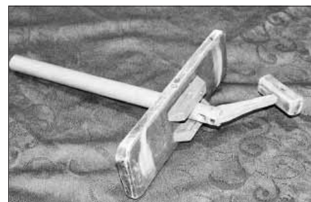
Klapper – Klapačka, Německo

Šedivé, někdy žluté úterý bylo spojené s úklidem domácnosti. Myla se okna, někde se bílilo, ale hlavně bylo potřeba