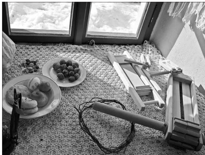
Různé druhy řehťaček – Kittelovo muzeum, výstava v roce 2021

pověry se v tento den lidé neměli mračit, aby se nemračili všechny středy v dalším roce. V tento den se pekly jídáše, které se jedly ve čtvrtek. Jedlo se ale nějaké „škaredé“ jídlo, přesněji jídlo, které se záměrně přichystalo jako nevzhledné.