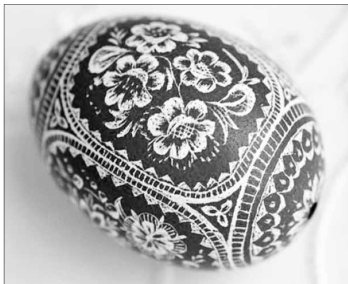
Vejce zdobená vyškrabováním