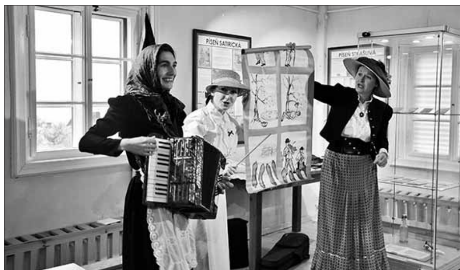
Kramářská píseň v podání liberecké skupiny Katastrofální předpověď počasí u příležitosti uvedení výstavy v Kittelově domě o sklářském víkendů 14.–15. 10. 2023

Písně předváděné potulnými písničkáři a muzikanty je věc velmi stará. S písničkáři se setkávali staří Řekové